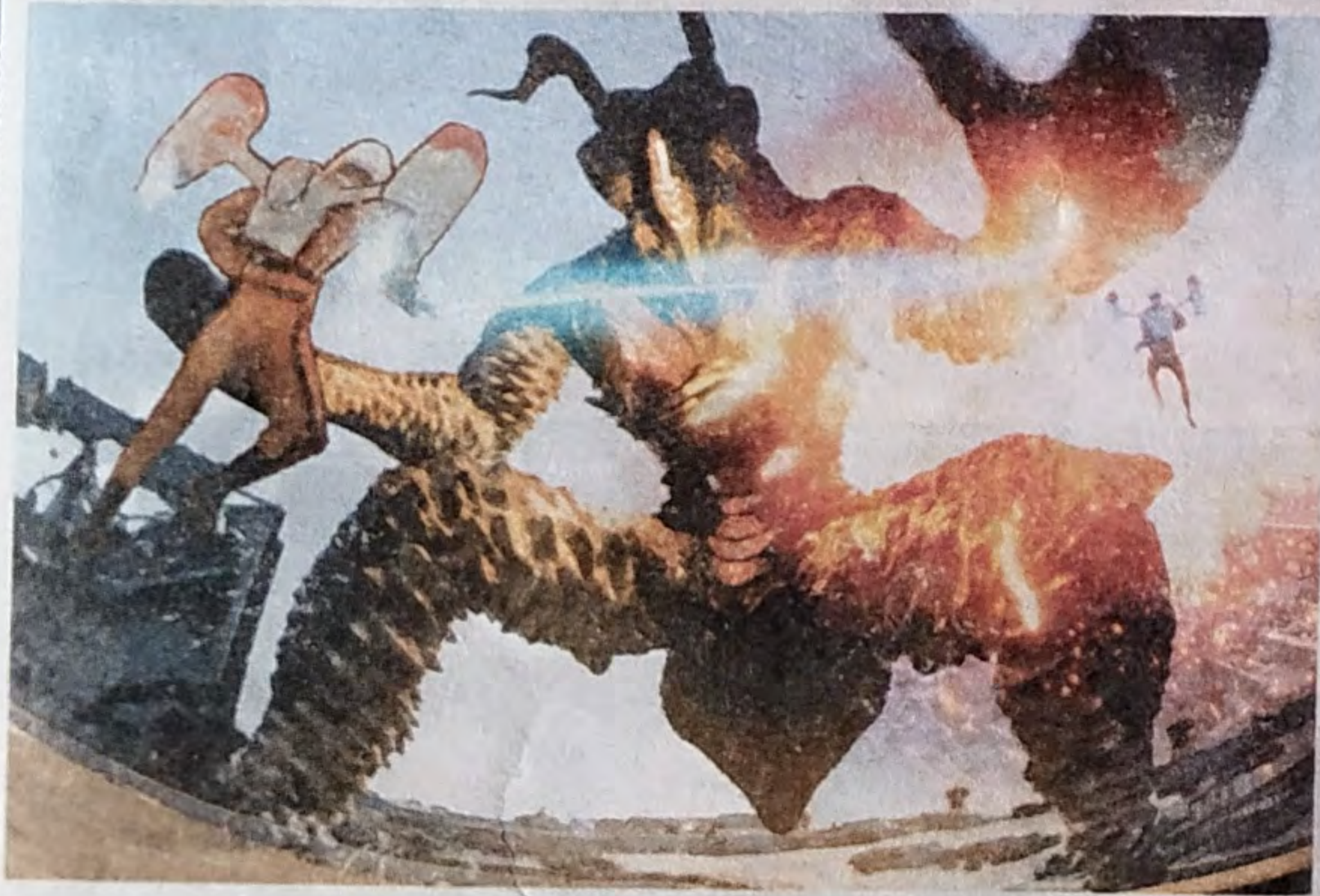
▲ 飛行装置「フローター」で応戦

所沢に科特隊の秘密基地がある。今回の戦闘で、そんな噂が再燃している。当地が誇る大型遊戯施設、西武園ゆうえんちの利用客に科特隊隊員の目撃談が多いことも、この噂の信ぴょう性を高めている。数多くの防衛設備や兵器、機器類の搬入を伴うであろう科特隊作戦支部の建設に、遊園地は絶好の隠れみみになるだろう。策士といわれる科特隊特別作戦支部キャプテン東堂氏の肝いりとなればあり得る話である。新兵器訓練現場への怪獣出現は果たして偶然だろうか。