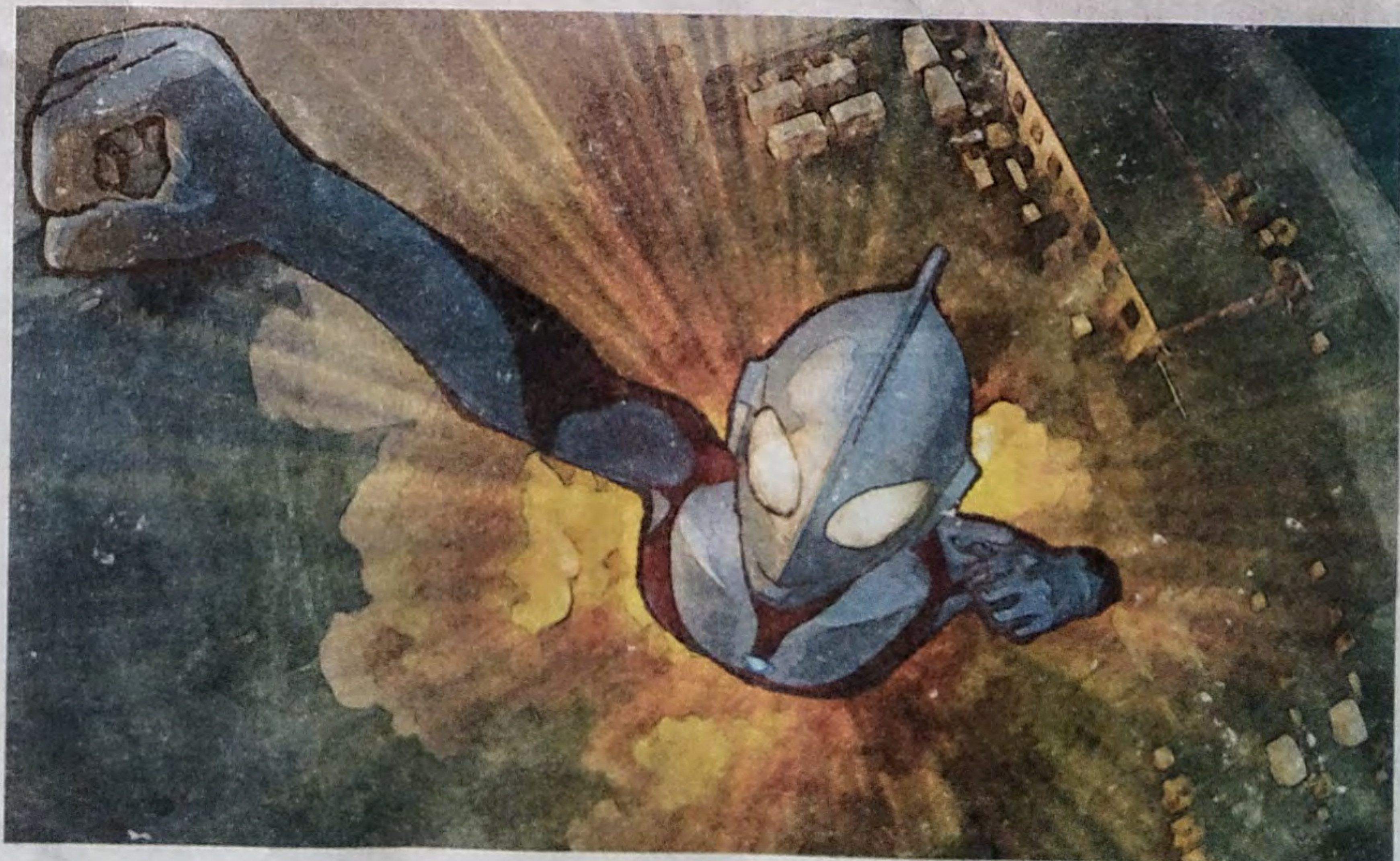
▲ 待望せらるるウルトラマン