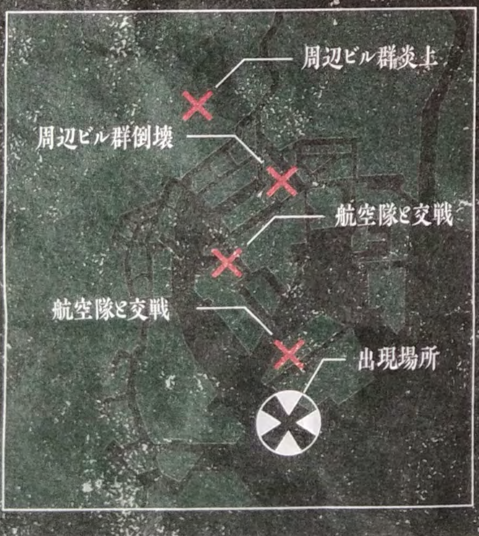
《湾岸地域の被害状況》

監視隊員は最新鋭の艦載ドローンシップ「グースワン」「グースツー」に搭乗し、監視、索敵の任に就く。両機は、海中、海上、空中を自由に行き来できる軽武装の索敵艇であり、軽武装のためゴジラ発見までがその任務となる。 発見後、速やかに殲滅作戦に移行。ついに開発に成功した待望のゴジラ制圧兵器「ゼロ式機獣Gブレイカー」の正式投入が決定している。その全容はいまだ明らかにされていないが、新兵器による事態の早期鎮静化が期待される。